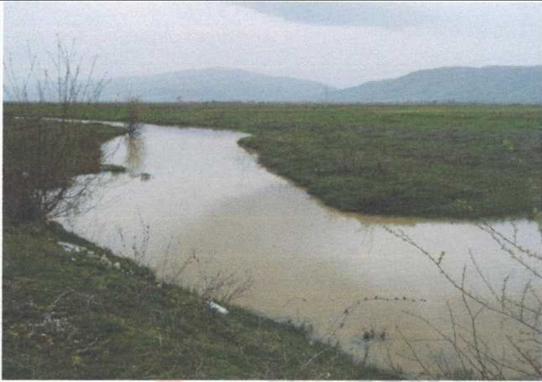
Локација: Лажани Блато, П= 1ха Lokaliteti: f. Liazhan, Bllato P=1ha