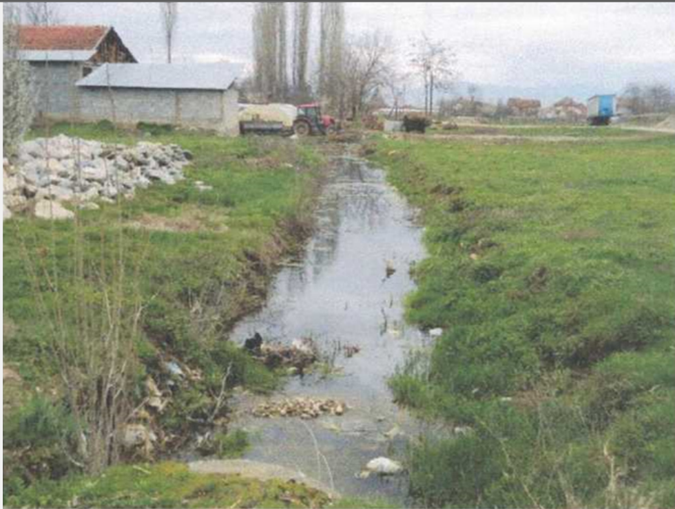
Локација: Десово, (1=0,5ха) Lokaliteti: f. Desovë (1=0.5 ha)