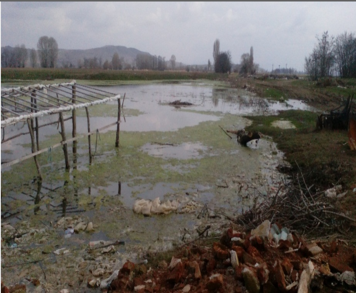
Локација: с. Секирци, П= 1ха Локалитети: ф. Debresht P=о.5 ха.

Врз основа на член 50, став 1, алинеја 3 од Законот за локална самоуправа ("Сл.весник на РМ" бр.5/02) и член 62, став 1, алинеја 4 од Статутот на општина Долнени ("Службен гласник на општина Долнени" бр.8/05, 04/09 и 02/10. Градоначалник на општина Долнени го донесе следниот: