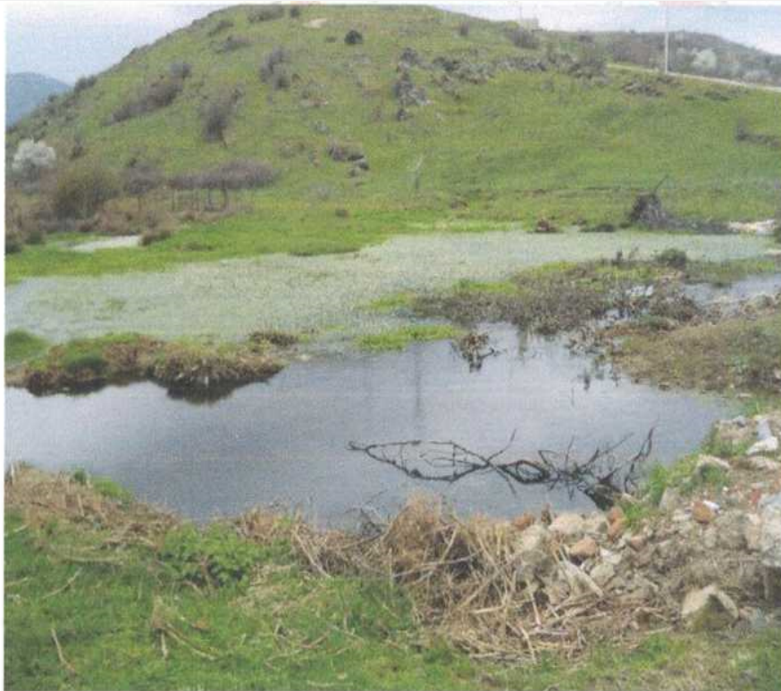
Локација: Бело Поле, П= 1ха Lokaliteti: f. Bello Pole P=1 ha.