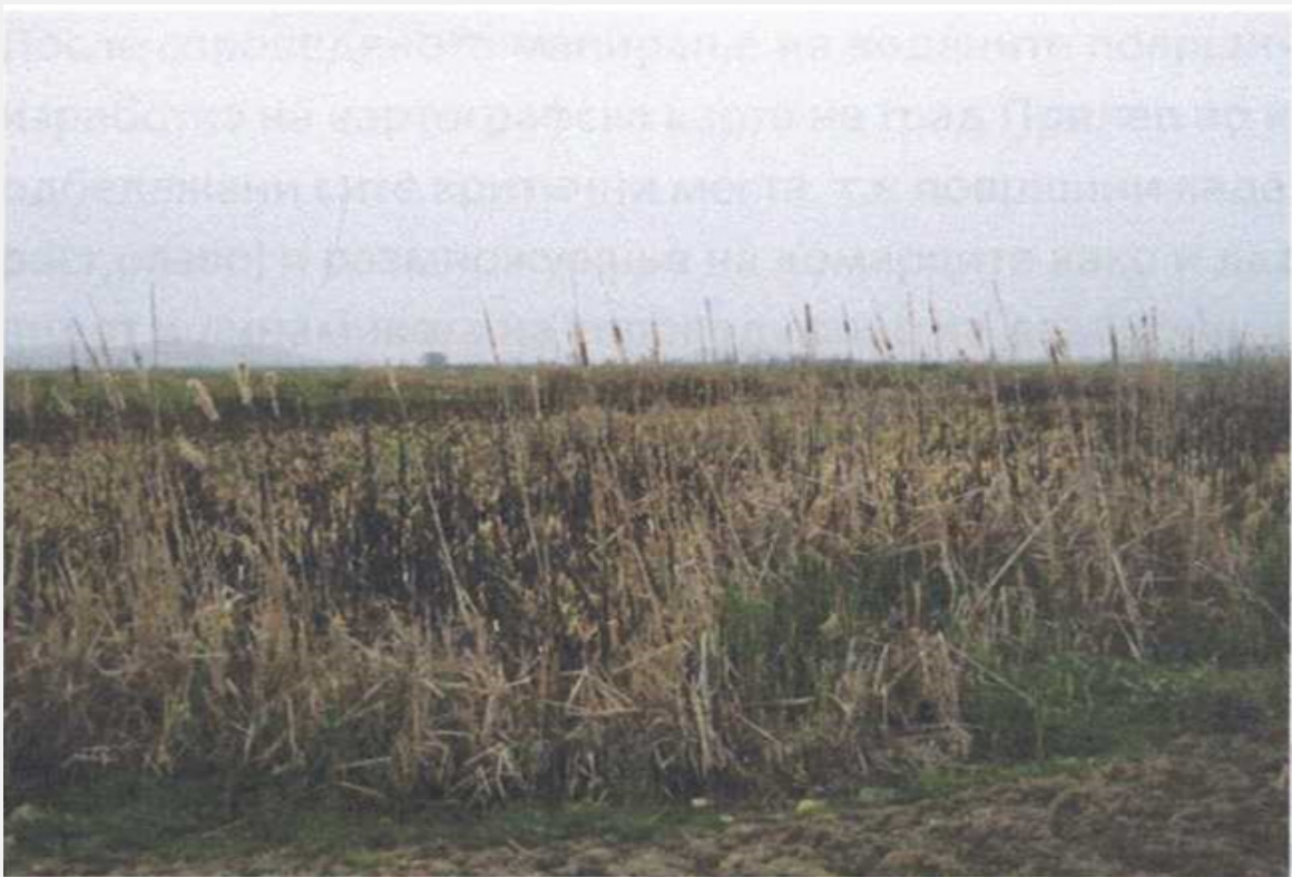
Локација: с. Вранче, П= 2ха Lokaliteti: f. Vrançe P= 1 ha.