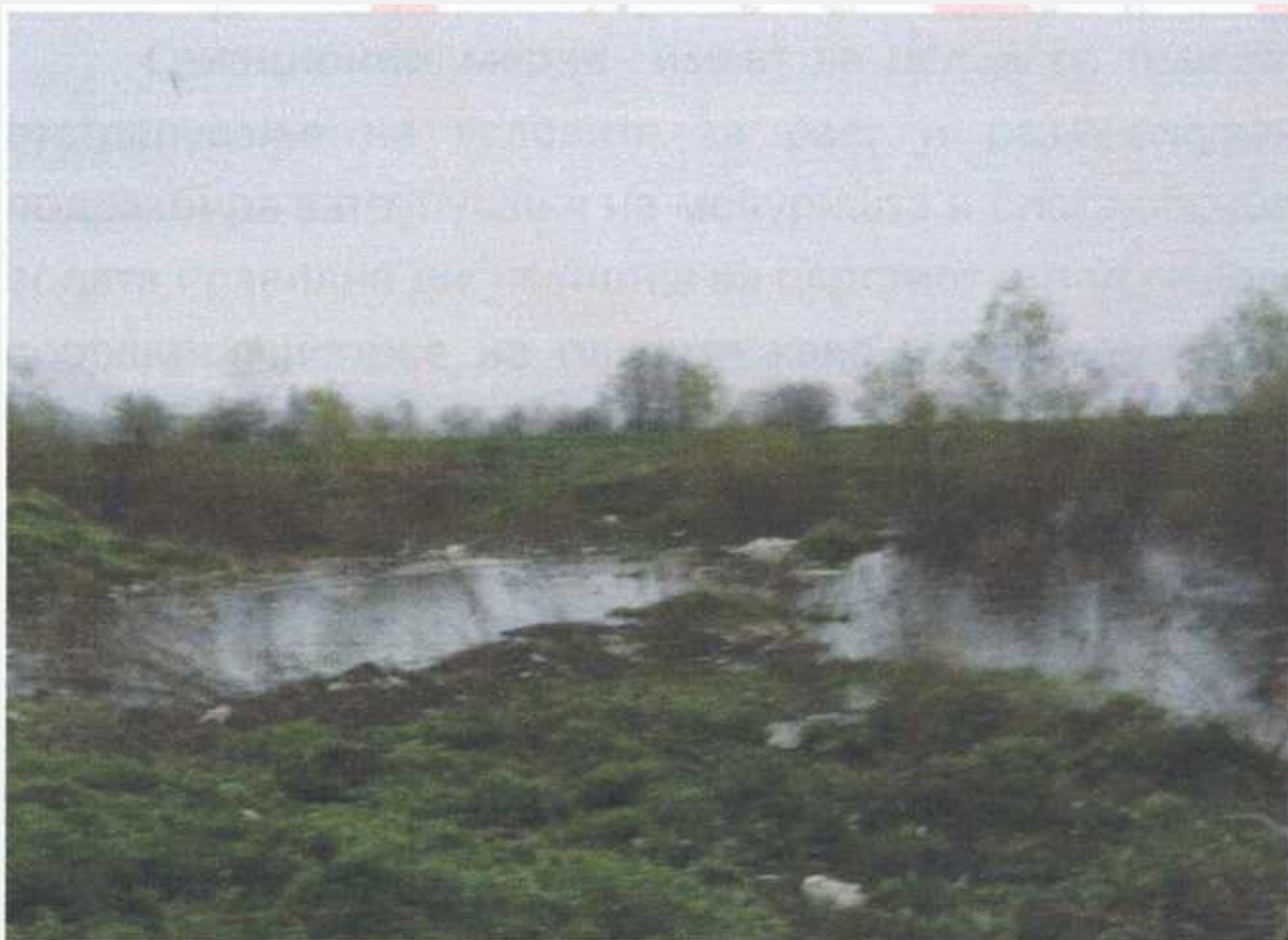
Локација: с.Ропотово, П= 1ха Lokaliteti: f. Ropotovë P=1 ha.